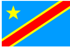
REP. DEMO. CONGO