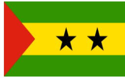
SAO TOME & PRINCIPE